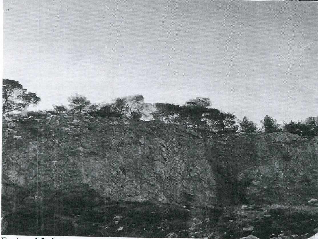
Εικόνες 1,2: Άποψη του γηπέδου του τέως ΧΑΔΑ